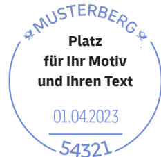
Beispiel: postalische Angaben im Stempel

Feste Bestandteile eines Sonderstempels sind immer die postalischen Angaben Ortsbezeichnung, Postleitzahl und Datum. Ein kunstvoll gestaltetes Motiv (Bild, Grafik, Illustration) und ein zum Anlass passender Text machen Ihren Sonderstempel komplett.