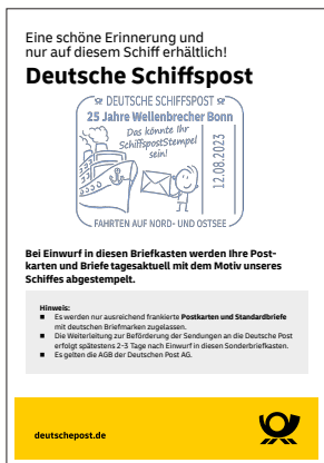
Beispiel: Schild zur Briefkastenkennzeichnung