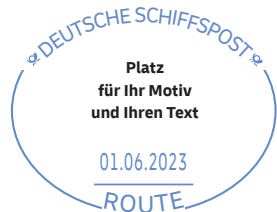
Beispiel: Pflichtangaben im Stempel

Weitere Bild-/Textbestandteile Ihres Stempelmotivs können Sie frei gestalten.