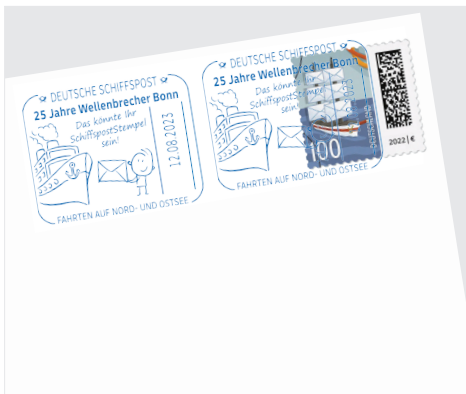
Beispiel: zusätzliche zweite Stempelung Ihres Motivs

Um einen DEUTSCHE SCHIFFSPOST-Stempel beauftragen zu können, müssen Sie als Reederei oder als Schiffseigner folgende Voraussetzungen erfüllen: