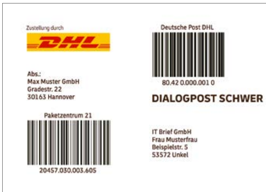
Beispiel für Adressaufkleber

Bitte beachten Sie, dass bei der Dialogpost Schwer keine Freimachungsvermerke, Freistempelungen oder Postwertzeichen möglich sind.