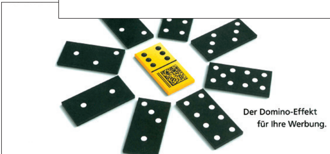
Beispiel: Postkarte DIN lang, 210 mm x 97 mm

Die Abbildung entspricht ggf. nicht der Originalgröße. Die angegebenen Maße sind bindend.