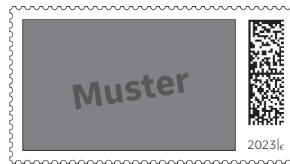
So groß wäre dein Bild auf einer Original-Briefmarke.